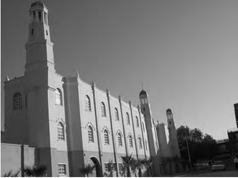
કાનમિયા મસ્જિદ, કંપ્ટાઉન, સાઉથ આફ્રિકા