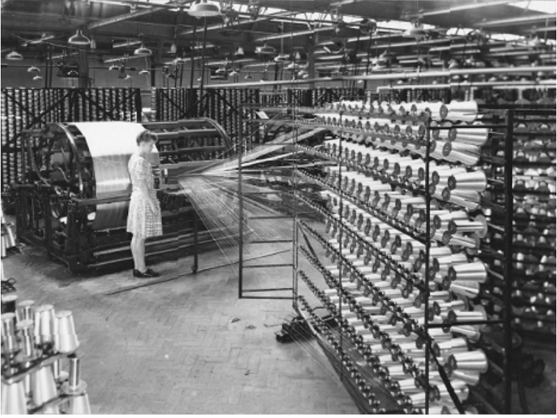
Courtaulds Rayon Spinning Factory

રહેઠાણની મુશ્કેલી અને અત્યંત ભીનાશવાળાં (damp) અને ઝાઝી ભીડભાડવાળાં (over crowded) મકાનોમાં રહેવાનું તથા અપૂરતા પોષણ (malnutrition) ને કારણે ઘણાં નવા આવનાર લોકો ટીબીની બીમારીનો ભોગ બનતા. બોલ્ટનના વયોવૃદ્ધ ઈખરના બશીરભાઈ છડાતના કહેવા પ્રમાણે બોલ્ટનની તે વેળાની Blair's Hospital અને Wilkinson's Sanatorium ટીબીના દર્દીઓથી ભરાયેલી રહેતી જેમાં મોટા ભાગના એશિયન દર્દીઓ હતા.