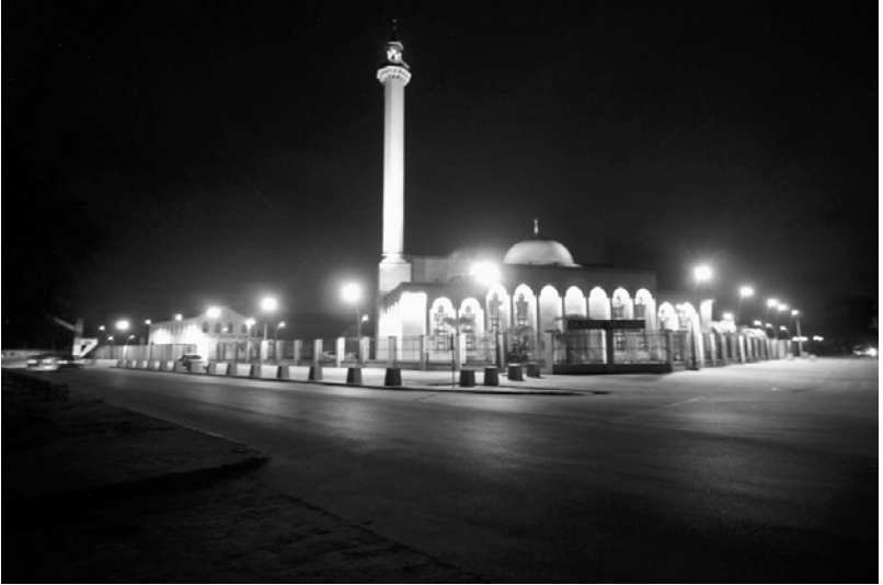
લુસાકા મસ્જિદ, ઝામ્બીયા